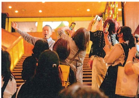
「東京建築祭2024」ガイドツアーの様様

普段は見られない建築を特別に公開する「建築公開イベント」が広まりを見せています。既存の文化財公開など何が異なるのでしょうか？そして、まちづくりとの関係は？国内最大の建築公開イベント「イケフェス大阪」が2014年に始まって以来の経験、国外の先行事例「オープンハウスロンドン」、国内の様々な場所で勃興しつつある事例を通じて、公開イベントが建築と市民をつなぐ様子をご紹介します。