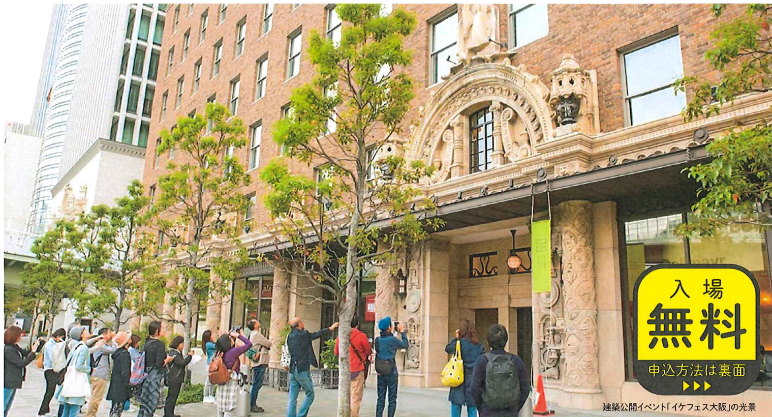
建築公開イベント「イケフェス大阪」の光景