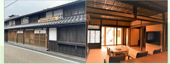
津山市 「城下小宿栞や」