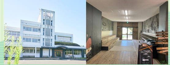
福知山市 THE 610 BASE